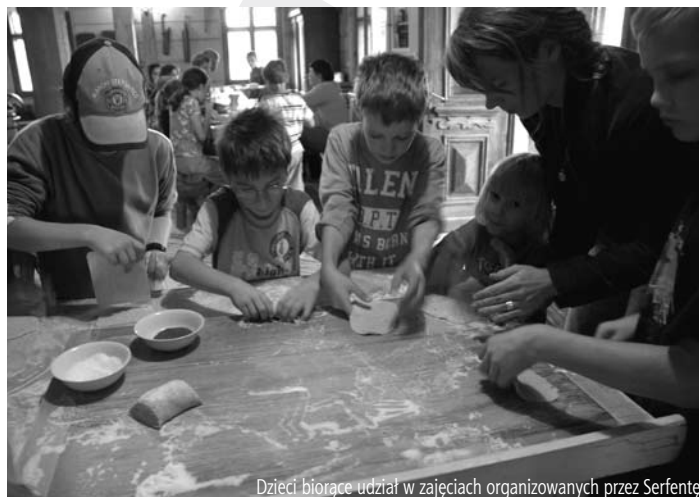
Dzieci biorące udział w zajęciach organizowanych przez Serfentę

Ze względu na ograniczoną liczbę miejsc obowiązują wcześniejsze zapisy. Więcej informacji pod numerem 0 665 580 337 i na stronie internetowej www.ekoklasa.edu.pl