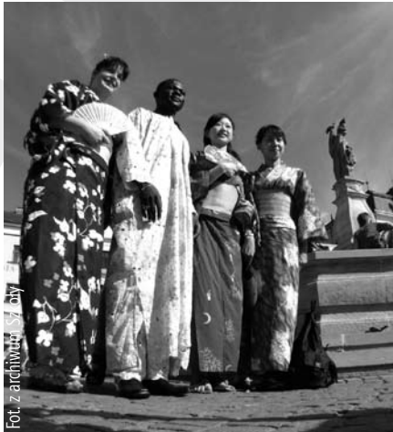
Uczestnicy ubiegłorocznego Wieczoru Narodów

Więcej informacji pod naszym katowickim numerem telefonu (czynnym do 30 lipca) 0 32 251 2991; cieszyńskim (czynnym od 31 lipca do końca sierpnia) 033 8546280 oraz na stronie internetowej: www.sjlkp.us.edu.pl . Szczegółowe informacje na temat „Sprawdzianu z polskiego” oraz „Wieczoru Narodów” ukażą się 22 sierpnia w „Wiadomości Ratuszowych”.