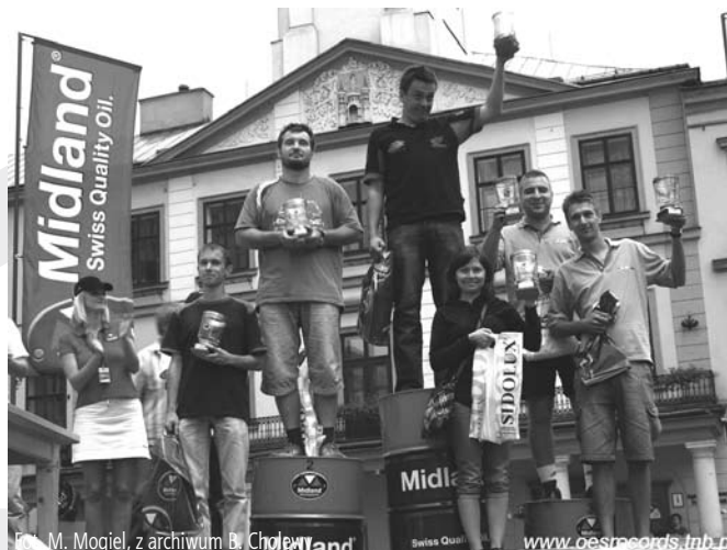
M. Mójciel, z archiwum B. Cholewy